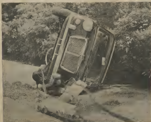
PRINSES MARGRIET DEN ACCIDENTE DI TRAFICO

Dial ma atardi prinses Margriet tabata envolvi den un accidente di trafico ariba e carretera di Den Haag pa Utrecht den cercania di Bodegraven, ora cu su auto a slip y dal contra un trankero di waya. E prinses a wordi herida levemente na su brazo, e auto a bay kenya di kensel un banda manera nos por weta ariba e grafica.